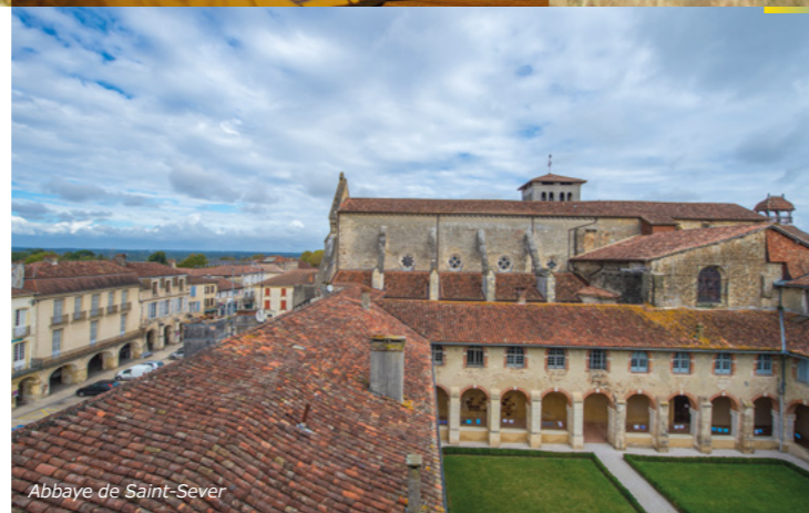
Abbaye de Saint-Sever