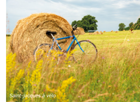
Saint-jacques à vélo