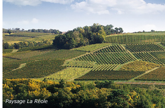
Paysage La Réole