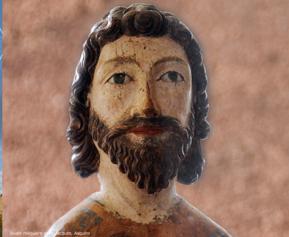
Buste reliquaire saint-Jacques, Asquins