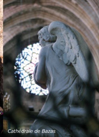
Cathédrale de Bazas