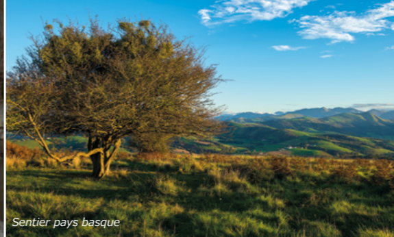
Sentier pays basque