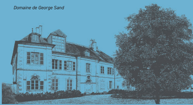
Domaine de George Sand

La vie de Chopin est faite de voyages, qu'ils soient liés à l'exil (Vienne, Paris), à l'amour (Dresde, Majorque, Nohant), ou à l'amitié (Allemagne, Angleterre). C'est à ces occasions qu'il construit sa vie et fréquente aussi des musiciens et des artistes qui deviennent des proches — ainsi Robert et Clara Schumann, Felix Mendelssohn ou encore Eugène Delacroix ; sans oublier George Sand qu'il rencontre à Paris par l'intermédiaire de Liszt et de Marie d'Agoult !