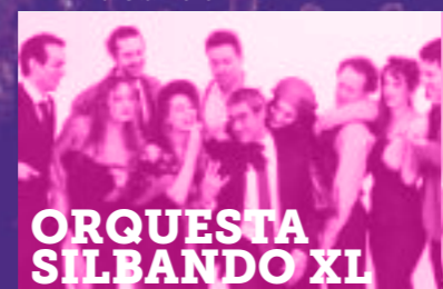
ORQUESTA SILBANDO XL